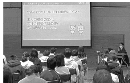
4/26(月):まちづくり探究①