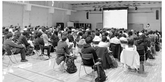
4/19(月)進路ガイダンスの様子

こんご ほんこう かつどう きょうりよく りかい たま ねが もう あ 今後とも本校の活動にご協力とご理解を賜りますよう、よろしくお願い申し上げます。